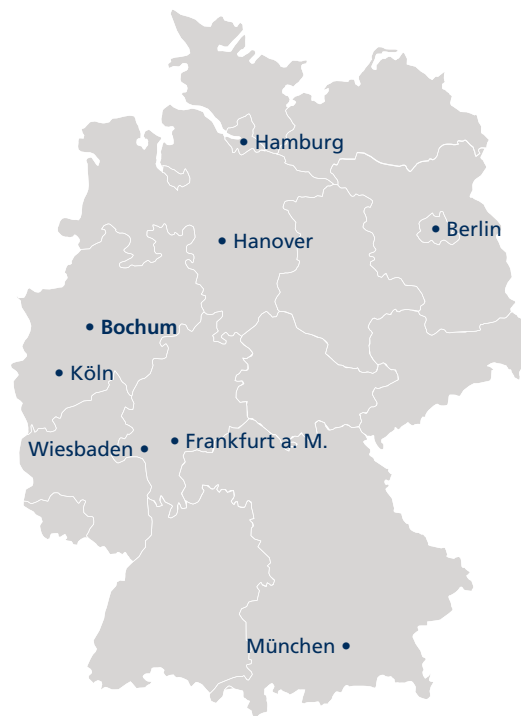
Standorte und Studienzentren in Deutschland